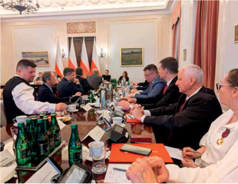
Первое заседание Совета