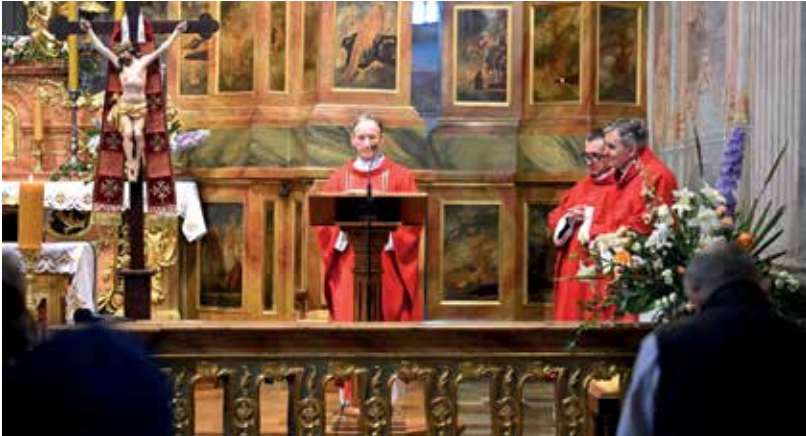
Uroczysta Msza święta